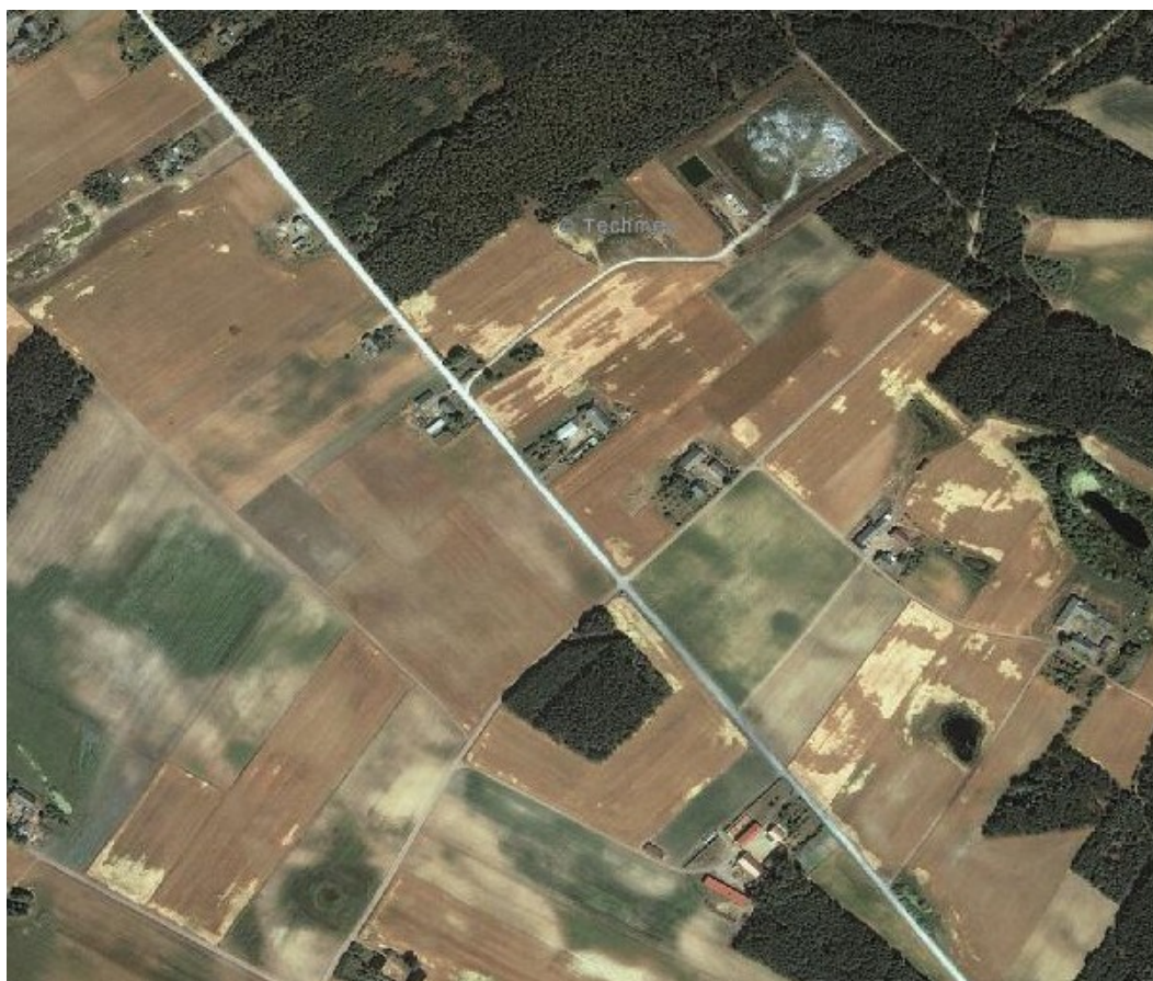
Fot. Zdjęcie satelitarne miejscowości Tuszynki

W zawartej poniżej analizie powierzchni odniesiono się do sołectw, ponieważ Gmina nie posiada informacji odnośnie powierzchni poszczególnych miejscowości, których w Gminie Bukowiec jest 16, a jedynie posiada dane dotyczące powierzchni sołectw (których liczba wynosi 13). W przypadku Tuszynek, tylko ta miejscowość wchodzi w skład sołectwa o tej samej nazwie, więc powierzchnia tego sołectwa wskazana poniżej równa się powierzchni owej miejscowości.