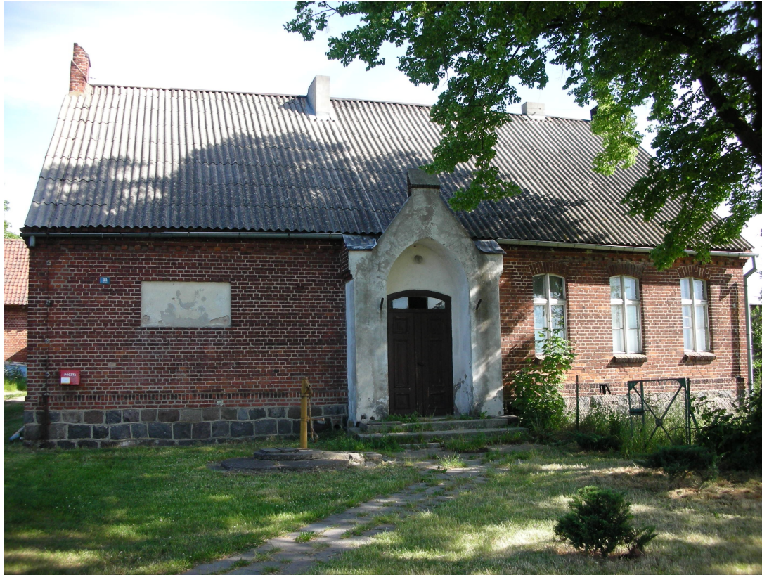
Fot. Budynek dawnej szkoły