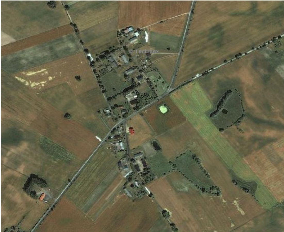
Fot. Zdjęcie satelitarne Plewna.

W zawartej poniżej analizie powierzchni odniesiono się do sołectw, ponieważ Gmina nie posiada informacji odnośnie powierzchni poszczególnych miejscowości, których w Gminie Bukowiec jest 16, a jedynie posiada dane dotyczące powierzchni sołectw (których liczba wynosi 13). W przypadku Plewna, tylko ta miejscowość wchodzi w skład sołectwa Plewno, więc powierzchnia tego sołectwa wskazana poniżej równa się powierzchni owej miejscowości.