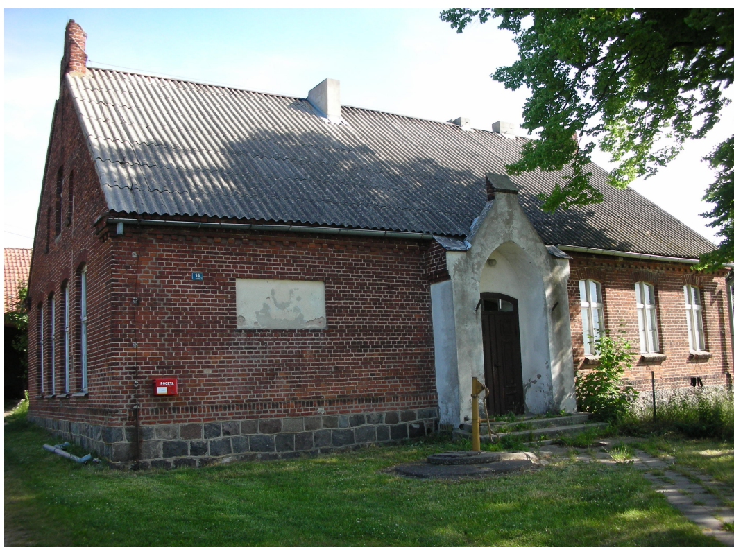
Fot. Budynek dawnej szkoły