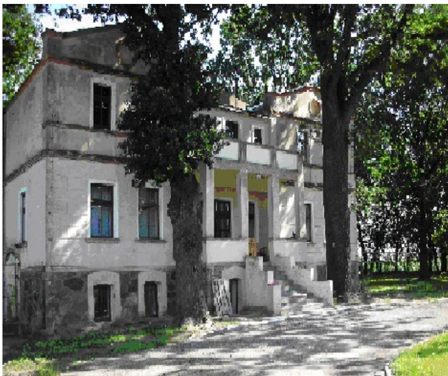
Fot. Pałac w Budyńiu