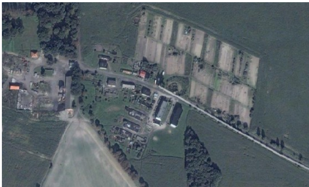
Fot. Zdjęcie satelitarne miejscowości Budyń.

W zawartej poniżej analizie powierzchni odniesiono się do sołectw, ponieważ Gmina nie posiada informacji odnośnie powierzchni poszczególnych miejscowości, których w Gminie Bukowiec jest 16, a jedynie posiada dane dotyczące powierzchni sołectw (których liczba wynosi 13). W przypadku sołectwa Budyń określono więc w poniższej tabeli zsumowaną powierzchnię trzech miejscowości, wchodzących w jego skład, a mianowicie Bydynia, Kawęcina i Jarzębieńca.